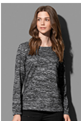
ST9180 Knit Long Sleeve