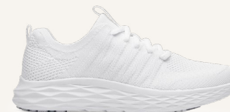
Everlight Blanc : 22275