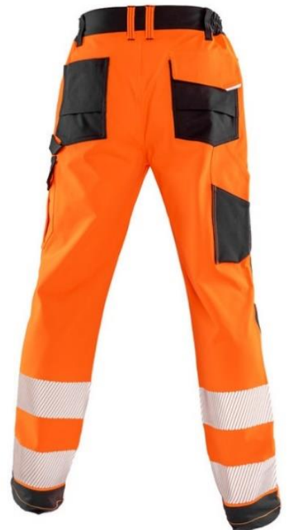
R517X RECYCLED DYNAMIC STRETCH SAFETY TROUSER