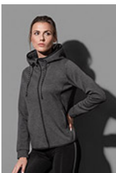
ST5940 Recycled Scuba Jacket