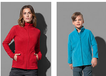
ST5100 Fleece Jacket ST5170 Fleece Jacket Kids