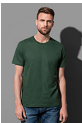
ST2100 Comfort-T 185