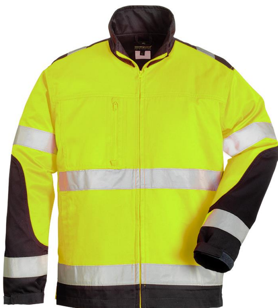
Jaune / Noir