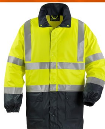
Jaune / bleu