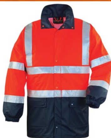
Orange – rouge/ bleu